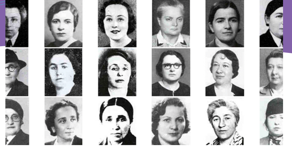
Seçme ve seçilme hakkını kazandıktan sonra 1935’te meclise giren ilk kadınlar

Türkiyede kadın hareketi 1800’lerin sonunda Birinci Meşrutiyetin ilan edildiği dönemde ortaya çıkmıştır. Bu dönemde kadınlar kamusal alanda aktör olma mücadelesi vermiş ve Türkiye’deki kadın hareketinin pek çok öncü ismi bu dönemde yetişmiştir. Fatma Aliye, Emine Semiye, Halide Edip, Nezihe Muhittin, Nigar Hanım, Gülnar Hanım gibi çok sayıda Osmanlı kadını yazıları ve bu yazıları geniş kitlelere duyurabildikleri basın organlarıyla kadınların kamusal alanda varolma mücadelesinin öncülüğünü yapmış ve böylece çok eşlilik, hukuksal eşitlik, eşit miras paylaşımı, boşanmada kadının da söz sahibi olması gibi konuların tartışılmasına ön ayak olmuşlardır. 1923 yılında Türkiye Cumhuriyetinin kurulması ise kadın hareketini bir sonraki evreye taşımıştır. Atatürk’ün Söylev ve Demeçleri’nde (2006, s.219) yer alan şu